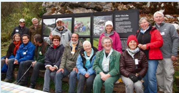
Die Alb-Guides freuen sich auf Sie!

Die Alb-Guides der Mittleren Schwäbischen Alb sind vom NABU Baden-Württemberg ausgebildete Landschaftsführer. Bei ihren geführten Touren erleben die Teilnehmer die Natur mit allen Sinnen und entdecken Zusammenhänge von Landschaft und Kultur in ihrer Region.